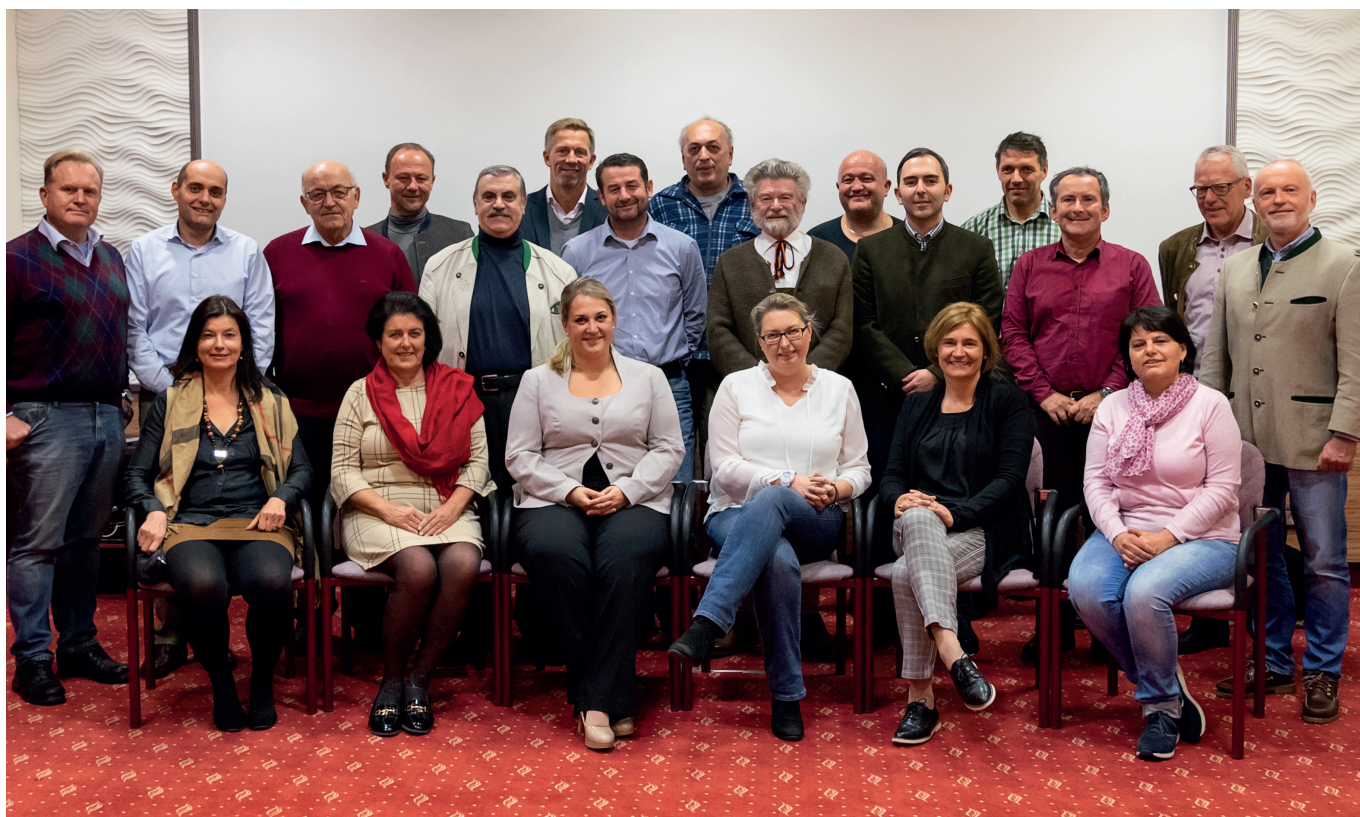
Teilnehmer des Seminars des Freiheitlichen Lehrerverbandes im November 2018 in Bad Hall.